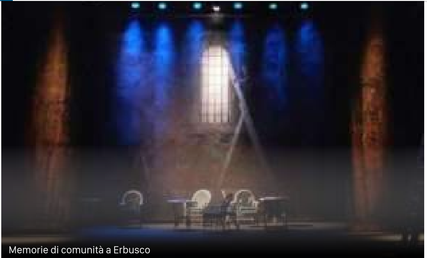
Memorie di comunità a Erbusco

FISC Federazione Italiana Settimanali Cattolici