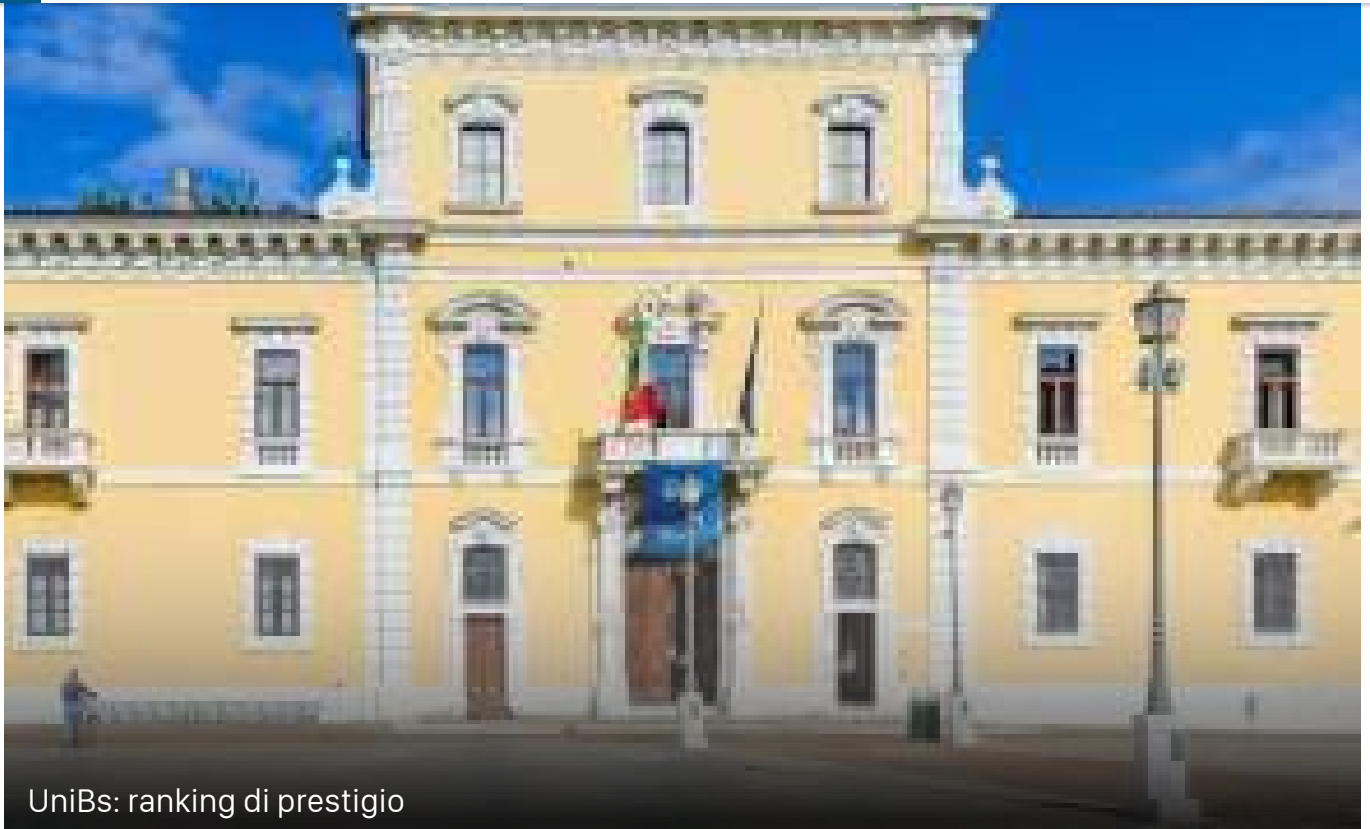
UniBs: ranking di prestigio